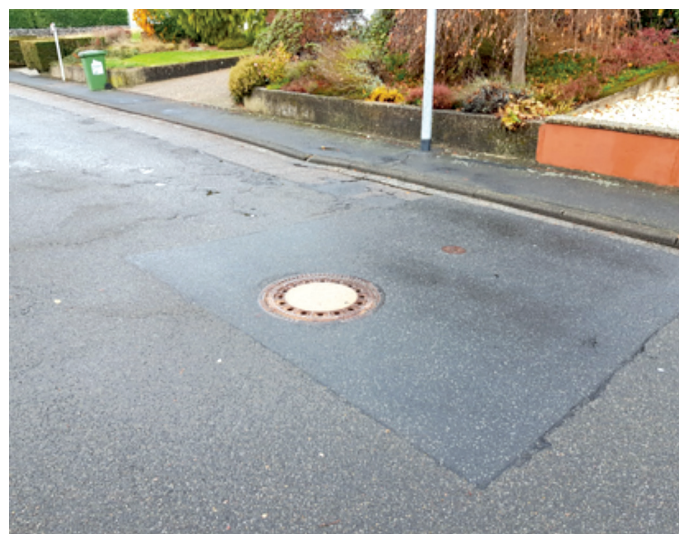
Beschädigter Straßenbelag in der Gartenstraße

Grundstückseigentümer kostenträchtige Ausbaubeiträge überhaupt noch erhoben werden sollen, werden wir keiner Beitragsbelastung der Bürgerinnen und Bürger zustimmen, bevor diese Frage nicht geklärt ist.