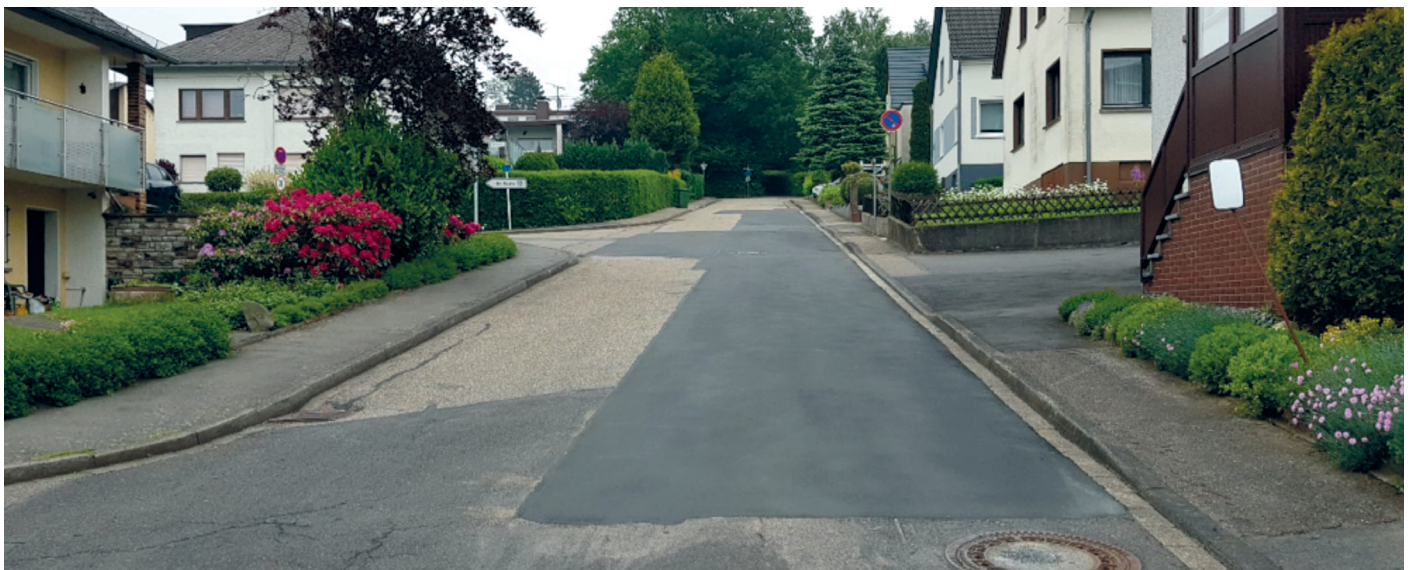
Die Höhenstraße nach der Instandsetzung